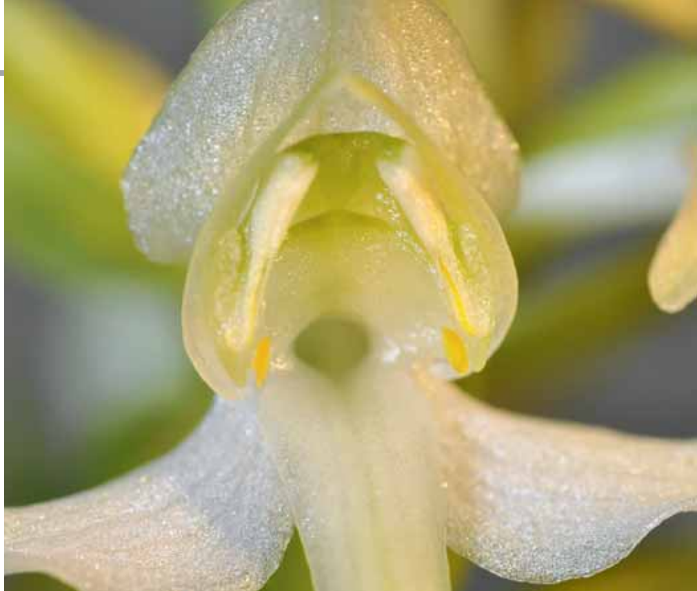
Platanthera chlorantha (Pollinien)

Vorkommen von Platanthera bifolia , Platanthera chlorantha und Dactylorhiza maculata in der Nordeifel (NRW)